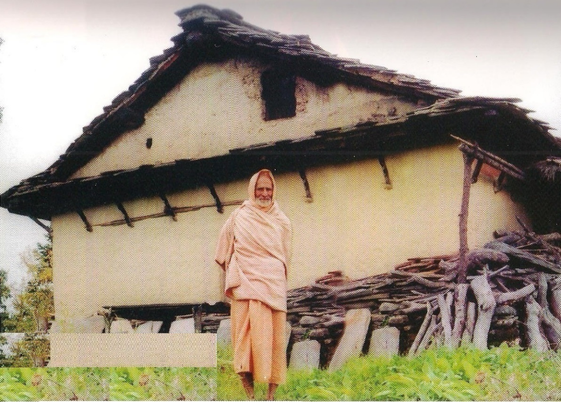
ब्रह्मज्ञानी परमपूज्य श्री १००८ खप्तडबाबा-तत्तपूरुष पून्यस्थलः-पवित्र पोतभूमि "श्री खप्तड-कुटिका"आगनमा २०३७ साल तिर